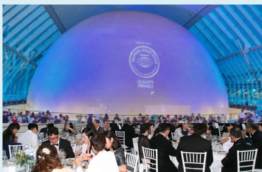
ガラディナーの様子