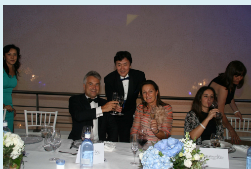
ハリューご夫妻と乾杯する松本社長