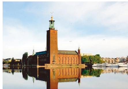
授賞式典会場「ストックホルム市庁舎」

モンドセレクションとは1961年に設立されたベルギーに本部を置く国際的な品評機関です。世界中の製品を審査する品評会としては、食品分野においては最も歴史があるといわれ、今年では世界中から3200点以上の製品が応募されました。もともとは菓子類を対象としていましたが、その後様々な食品分野へカテゴリーが拡大されて行き近年では化粧品などの非食品分野を対象とした部門も設けられています。出品された製品に対する審査は、訓練を受けた専門パネラーによる味覚検査とともに、分析機関による衛生検査や