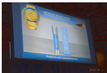
5年連続最高金賞受賞のルーテック・ モイスチャージェルが 会場のスクリーンに