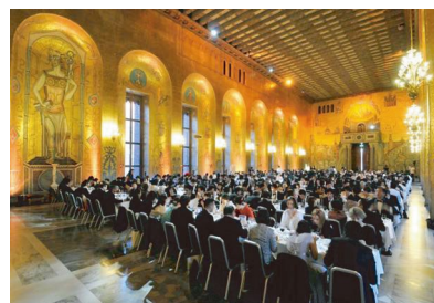
「黄金の間」にて、伝統的な ガラ・ディナーの様子

去る5月31日、2013年度のモンドセレクション授賞式が、スウェーデンのストックホルムにある市庁舎にて盛大に行われ、世界中から大勢の受賞者が参加されました。